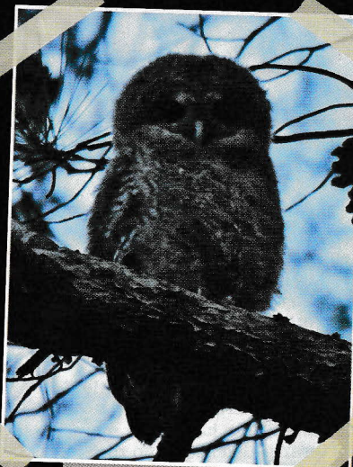
▲ Mladič lesne sove

Ko so lesne sove stare eno leto, si poiščejo partnerja, s katerim ostanejo vse življenje. Izberejo si svoje ozemlje, ki se z leti zelo malo spreminja. Starša skrbita za mladičke dva do tri mesece. Po tem času si mlade lesne sove poiščejo svoje ozemlje. Starša mladiče neustrašno branita. Tega se dobro zavedajo obročkarji ptičev, ki se morajo pri obročkanju mladih sov zaščititi s čeladami z vizirji.