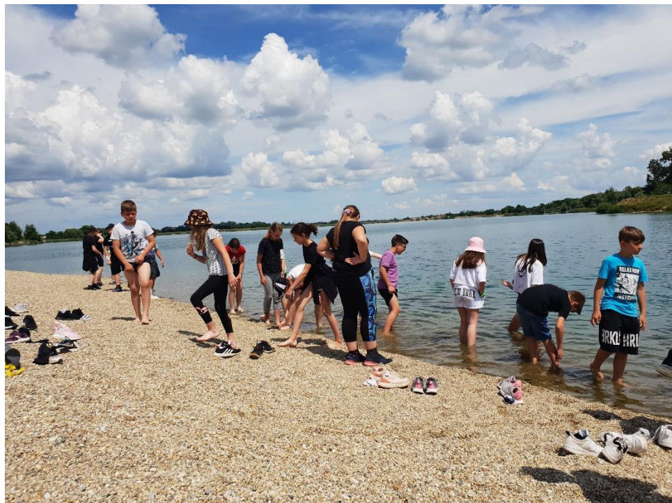
Petošolci na končnem izletu